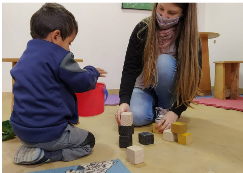
Estudiantes realizando sus prácticas pre profesionales