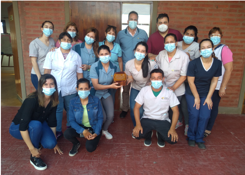
Parte del Equipo de profesionales y auxiliares del Centro, recibiendo la distinción

La Fundación para el Desarrollo del Centro Chaqueño (FUNDECCH) fue galardonada por la Orden del Quebracho 2021, máxima distinción que otorga el Rotary Club Saenz Peña, por su obra de protección y promoción de la primera infancia en zonas vulnerables, a través del Centro FUNDECCH (Centro CONIN Roque Saenz Peña).