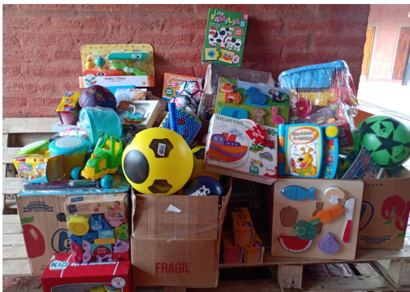
Donación de juguetes de ChangoMas