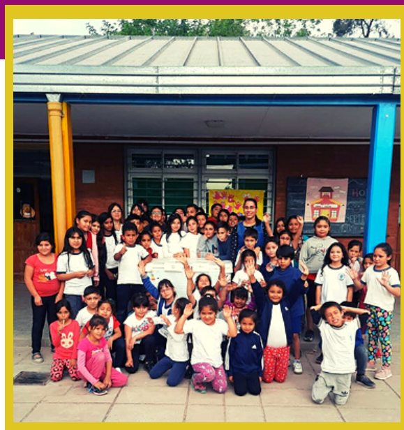
Alumnos EEP N° 619 "Edmundo Esteban Podestà"

La empresa Chango Más donó un termotanque de 120 lt y un freezer, a partir de lo cual se realizaron dos convocatorias (mes de junio y octubre respectivamente). Se benefició a las escuelas que cumplieron con una serie de requisitos objetivos. En la primera convocatoria fueron seleccionados la EES 145 anexo y EEP 64, de Colonia Rivadavia Lote 23, impactando en 70 alumnos del nivel secundario, y 80 alumnos del nivel inicial y primario.